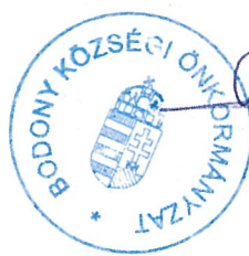
Vince János polgármester